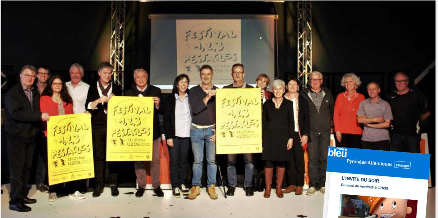
📸 Les organisateurs sont heureux de retrouver l'événement en 2022.

BORDEAUX ARCACHON LIBOURNE LA ROCHELLE SAINTES ROYAN COGNAC ANGOULÊME PÉRIGUEUX AGEN PAU BAYONNE BIARRITZ MONT-DE-MARSAN DAX